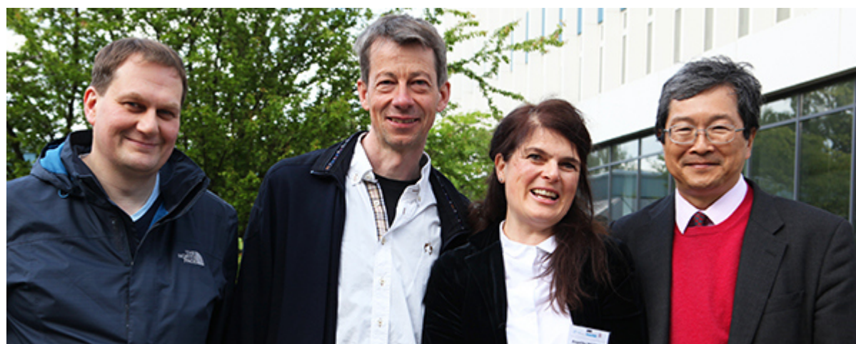
Download unter der Meldung.